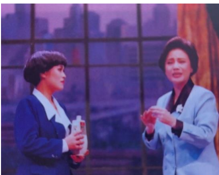
『母親的情懐』 （出典『上海滬劇志』1999）

逸夫（天蟾）舞台のような格式高い劇場での公演もあるが、多くは大世界の隣にある共舞台をはじめ、中規模以下の劇場で演じられる。江南人にある容姿なのか、筆者は地元観客に紛れて座っていても外国人とはバレなかった。隣に座る男性客に「主役のコイツ、劇団から独立してんけど、うまく行かんと出戻ってきたんやで……あー、下手になってへん？」と語りかけられたかと思うと、後ろから背中を突かれ「これ食べや。前に回して」と果物の入った袋を肩越しに渡される。こうしたカジュアルな上演空間でのコミュニケーションも、滬劇を観る楽しみの一つである。（ふじの なおこ 関西学院大学教授）