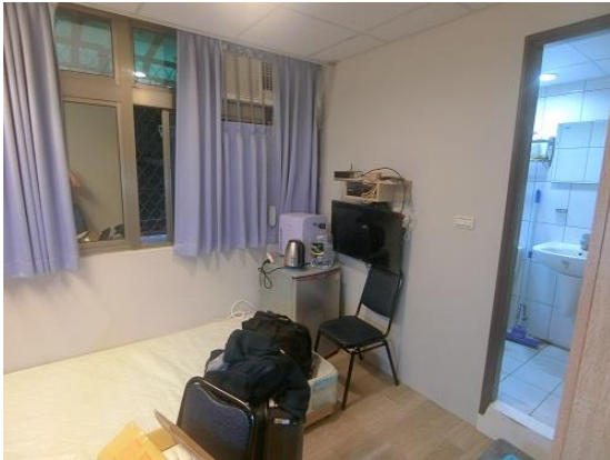
住むことになった家

隔離ホテルから不動産契約代行業者と一緒に乗ったタクシードが、借りる家の候補地に着くと、そこには不動産屋の方が待っていました。そして、写真では「この家で問題ない」と了承していたものの、念のための家の最終確認です。その借りることになった家は、一間、トイレ・シャワー付きで、共用部分に洗濯機・乾燥機ありの学生用アパートでした。とりあえず、内部を確認して、居住するにしても、問題がなさそうであったため、家を借りる契約をそのまま確定することにしました。そして、隔離ホテルから一緒に来た不動産契約代行業者と不動産屋に現金で報酬を支払い、借りることにした家の契約書を受け取りました。